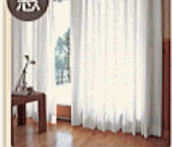
エアファイン機能付カーテン