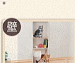
キャットステージ