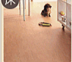
ニュークリネスシート