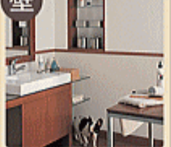
サイクル消臭壁紙