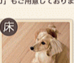
ワンラブオトユカ