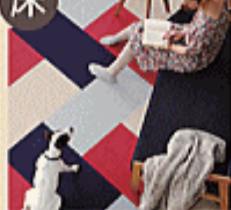
ファブリックフロア

洗面所などの水回りには、消臭・分解機能のついたペット用クッションフロア「ニュークリネスシート」がぴったりです。