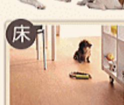
ニュークリネスシート