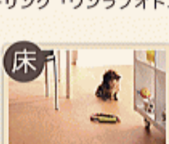
ニュークリネスシート