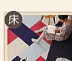
ファブリックフロア

ペットの粗相などによる床のよごれに最適なフロアをご用意しました。「ファブリックフロア」なら防汚・撥水機能が備わっている上、手洗いも可能です。「ニュークリネスシート」はシート状の商品なので建物におしこなどが浸み込むこともありません。