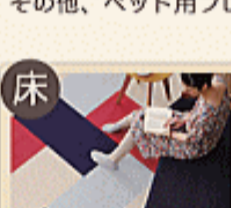
ファブリックフロア

床がやわらかく使える、猫ちゃんも「キャットタワー」で思う存分遊べますね。併せて洗面所、廊下などはお手頃価格なペット用クッションフロア「ニュークリネスシート」もいかがでしょうか？その他、ペット用フローリング「ワンラブオトユカ」もご用意しております。